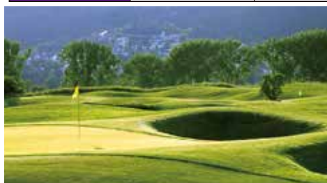
プラハシティゴルフクラブ 18H 7,173Y P72 J.フォード設計 '09年開場