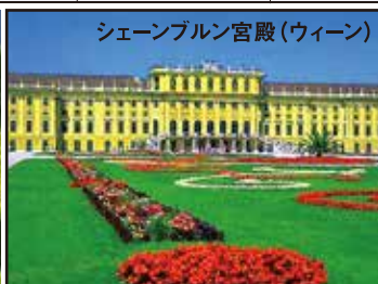
シェーンブルン宮殿(ウィーン)