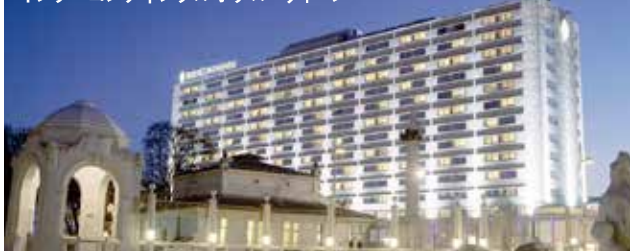
インターコンチネンタルホテル・ウィーン

有名ナリング通りにあるホテル。白を基調とした外観はモダンで清潔感に満ち溢れ、客室もダークブラウンの家具が落ち着いた雰囲気醸し出している。楽友教会やオペラ座も徒歩圏内と大変便利。