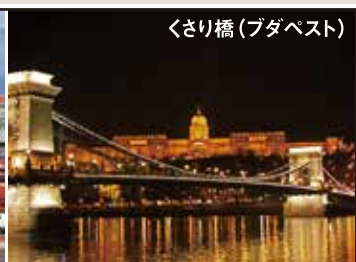
くさり橋(ブタペスト)

ヨーロッパのほぼ中央に位置する中欧三国（オーストリア、チェコ、ハンガリー）13世紀ヨーロッパ全土を支配しハプスブルグ家の王朝として詠歌を極めたオーストリア・ウィーンは音楽の都として名高く、モーツァルトやバッハなどの著名な音楽家を輩出した。10世紀以降、貿易の中心として栄えたチェコの首都プラハは「百塔の街」と讃えられ世界遺産に登録されている。2本の大河が流れるブタペストは他国の支配や影響を受けながらも独自の文化を守り続けた町です。文明のルーツは共通ながら歴史と文化の歩み、豊かな自然風景にはそれぞれ異なる魅力ある中欧三都をお楽しみ下さい。