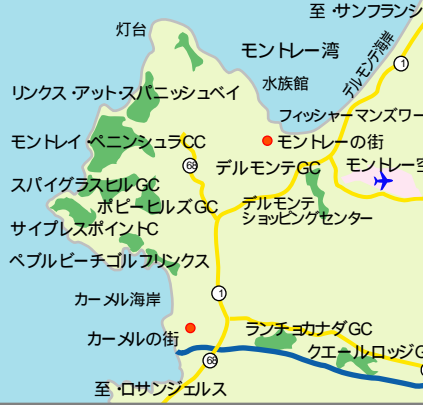
至・ロサンゼルス

パームスプリングスを代表するリゾートホテル「ラキント」に泊まって隣接の5コースを日が暮れるまでラウンド！ 3日間フリーラウンド