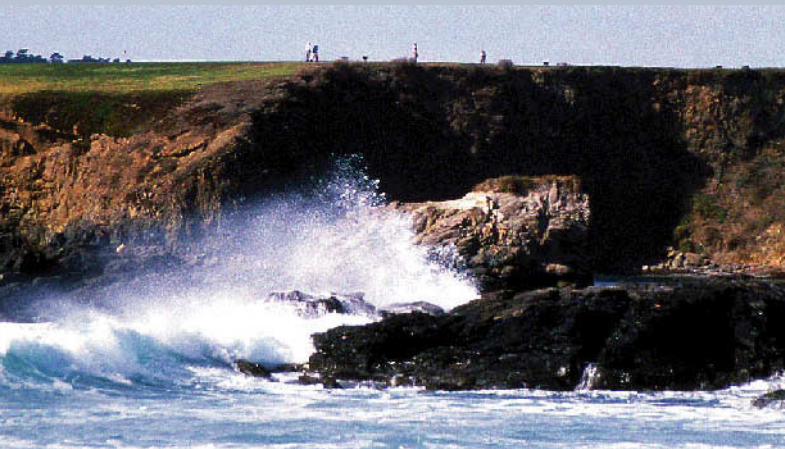
ペブルビーチゴルフリンクス 18H 6,799Y P72 Jネ・ビル / D Grant設計 1919年開場