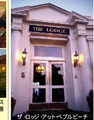
ザ・ロッジ・アット・ペブルビーチ