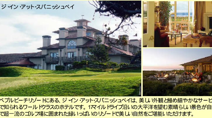
ペブルビーチリゾートにある、ジェイン・アット・スパニッシュベイは、美しい外観と極め細やかなサービスで知られるワールドクラスのホテルです。1マイルドライブ沿いの太平洋を望む素晴らしい景色が自慢で超一流のゴルフ場に囲まれた緑いっぱいのリゾートで美しい自然をご堪能いただけます。