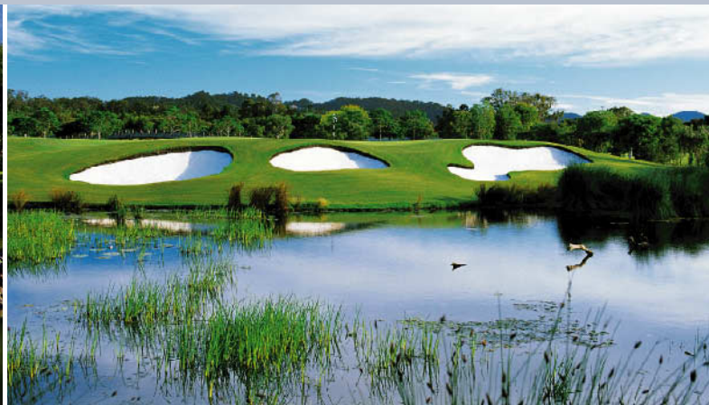
ザ・グレイズゴルフクラブ 18H 7,024Y P72 Gノーマン設計 2000年開場