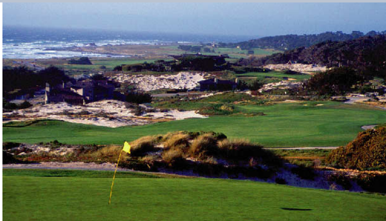
スパイグラスヒルGC 18H 6,855Y P72 R.T.ジョーンズSr (ジュニアの父)設計