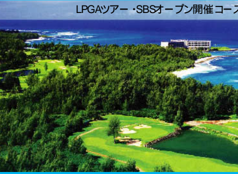
マウイ島 ワイレアゴルフクラブ・エメラルドコース