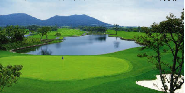
エリシアンカントリークラブ 36H 14,291Y P144 2008年開場