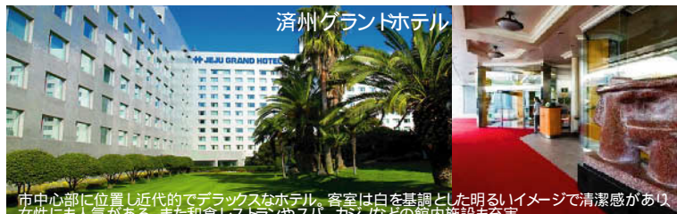
濟州グランドホテル 市中心部に位置し近代的でデラックスなホテル。客室は白を基調とした明るいイメージで清潔感があり女性にも人気がある。また和食レストランやスパ、カジノなどの館内施設も充実。