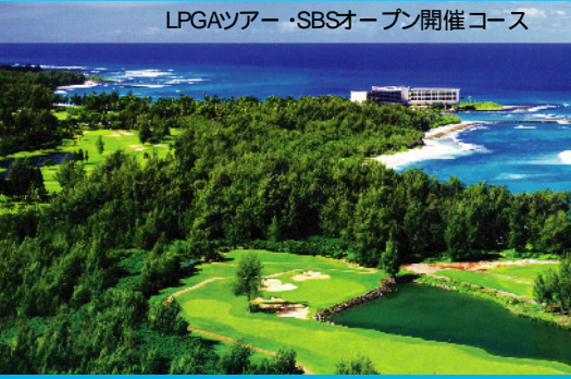
マウイ島 ワイレアゴルフクラブ・エメラルドコース