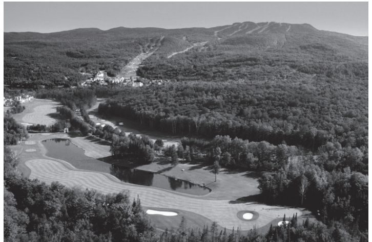
ル・ギャンゴルフコース