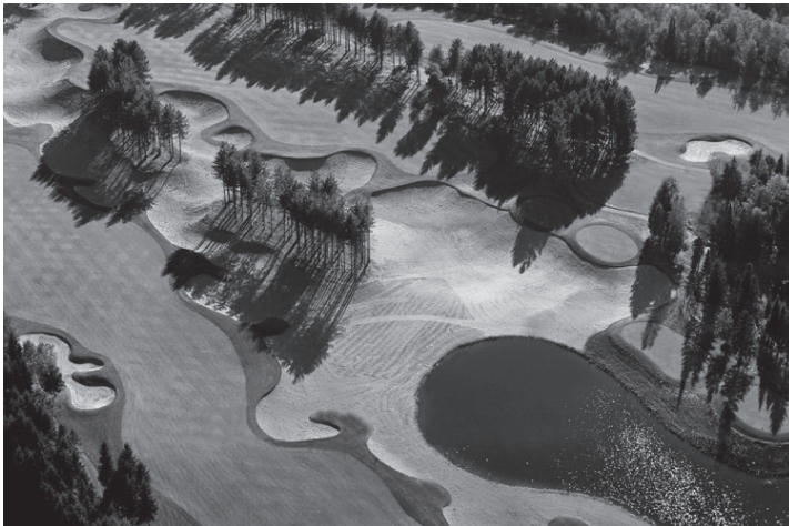
ル・ディアブルゴルフコース