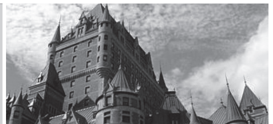
世界遺産の街ケベックシティ