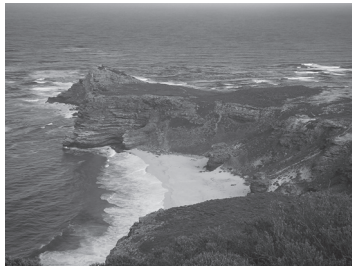
アフリカ大陸最西南端・喜望峰