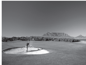
ミルネルトン・ゴルフクラブ