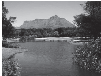
モウブレイ・ゴルフクラブ