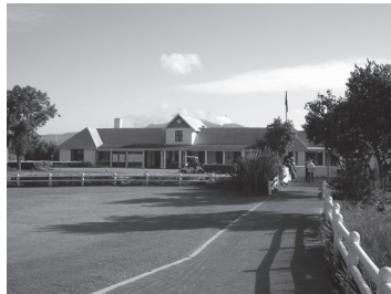
アフリカ大陸最古のロイヤル・ケープG.C.