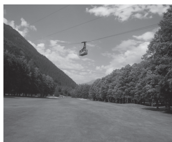
ゴルフクラブ・ド・シャモニー