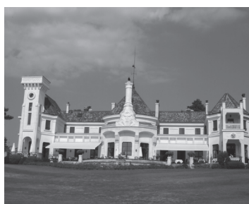
ドメイン・インペリアル・ゴルフクラブ