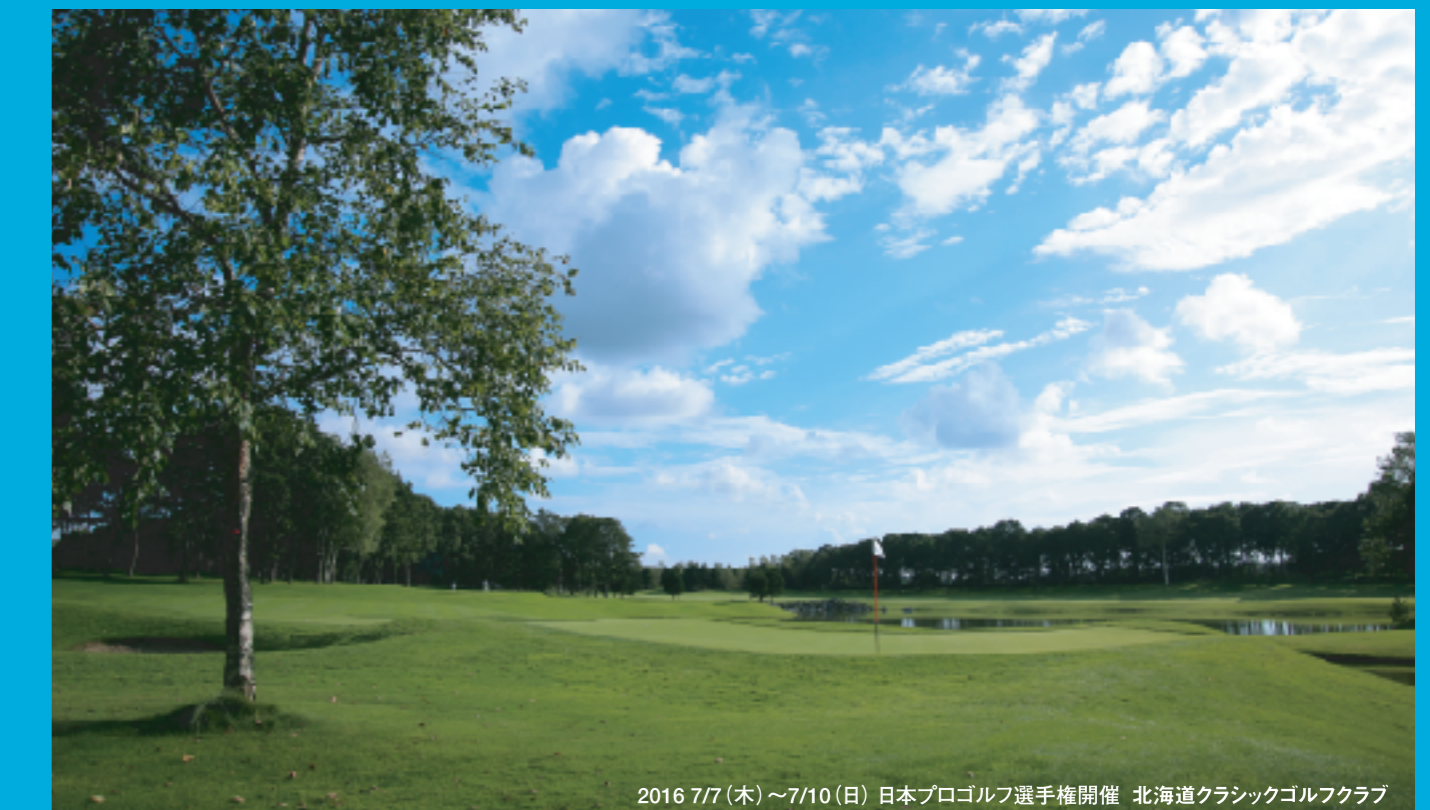
2016 7/7 (木)～7/10 (日) 日本プロゴルフ選手権開催 北海道クラシックゴルフクラブ