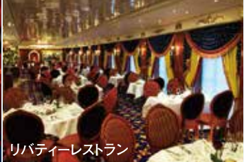
リパティールレストラン