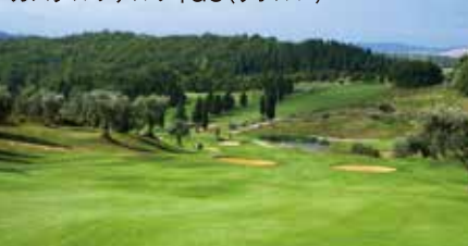
カステルファルフィGC(リボルノ)