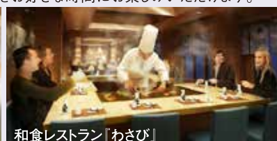
和食レストラン「わさび」