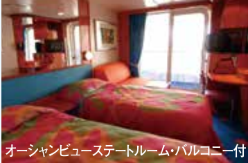
オーシャンビューステートルーム・バルコニー付