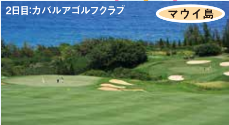
2日目:カパルアゴルフクラブ マウイ島