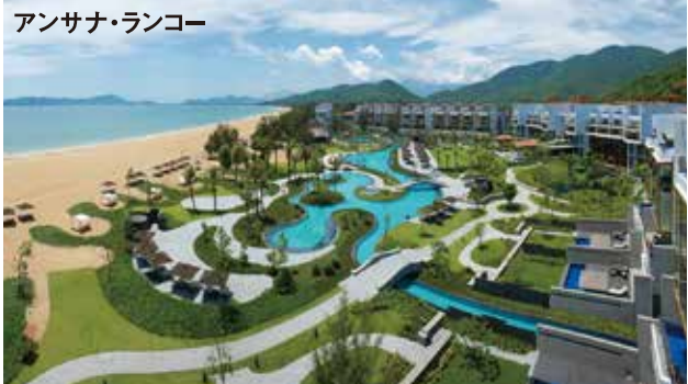
ラグーナ・ランコーGC 18H 7,100Y P71 C.ファルド設計 '13年開場