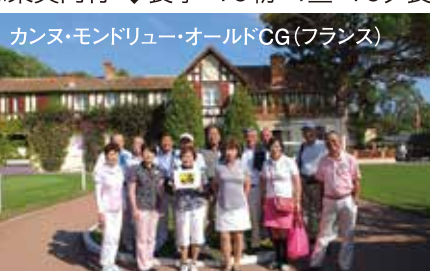
カンヌ・モンドリュエール・オールドCG(フランス)