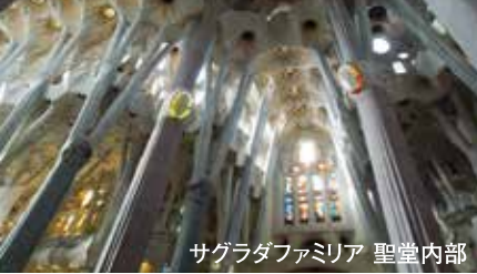
サグラダファミリア 聖堂内部