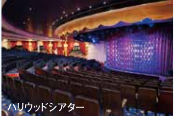
ハリウッドシアター