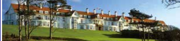
ターンベリーホテル

セントアンドリュース・オールドコース17番ホールに面したスコットランドを代表するデラックスホテル。最上階のレストラン「ロードホール」からはオールドコースのR&Aクラブハウス、遠く北海を望む景色が広がる。