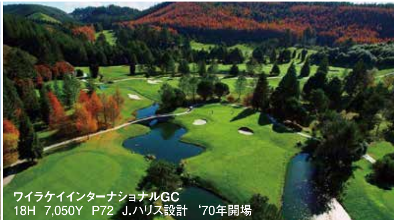
ワイラケインターナショナルGC 18H 7,050Y P72 J.ハリス設計 '70年開場

日中の最高気温25度前後と爽やかな気候の中、雄大な景色が広がるタウボ湖畔に泊まり、ワイラケインターナショナルGCとJ.ニクラス設計のキンロッククラブをプレー。想いで創りに、スリル満点の断崖絶壁“ケープ・キッドナッパーズ”を2ラウンド!