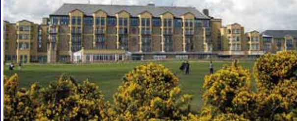
オールドコースホテル

セントアンドリュース・オールドコース17番ホールに面したスコットランドを代表するデラックスホテル。最上階のレストラン「ロードホール」からはオールドコースのR&Aクラブハウス、遠く北海を望む景色が広がる。