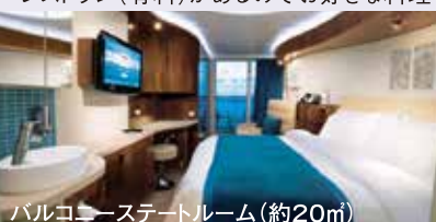
バルコニーステートルーム(約20㎡)

とかくヨーロッパのクルーズ船は朝・昼・夕食を毎日同じテーブルで主に洋食をお楽しみ頂く事になりますが、ノルウェー ジャンクルーズの「フリースタイルクルージング」は6カ所の無料レストランの他にステーキやイタリアン、中華に和食も楽しめるスペシャリティーレストラン(有料)があるので好きな料理をお好きな時間にお楽しみいただけます。