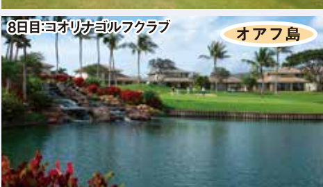
8日目:コオリナゴルフクラブ オアフ島