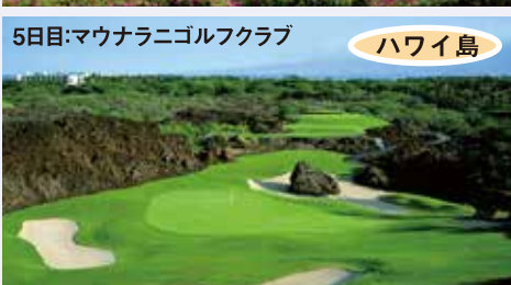
5日目:マウナラニゴルフクラブ ハワイ島