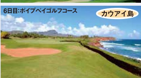
6日目:ポイプベイゴルフコース カウアイ島