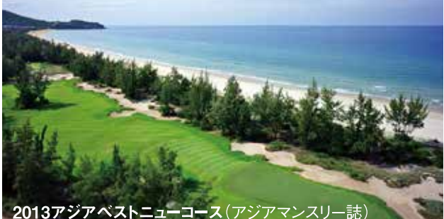
2013アジアベストニューコース(アジアマンスリー誌)