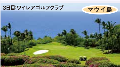
3日目:ワイレアゴルフクラブ マウイ島