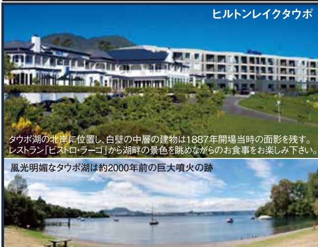
ヒルトンレイクタウポ

タウボ湖の北岸に位置し、白壁の中層の建物は1887年開場当時の面影を残す。 レストラン「ビストロ・ラーゴ」から湖畔の景色を眺めながらのお食事をお楽しみ下さい。