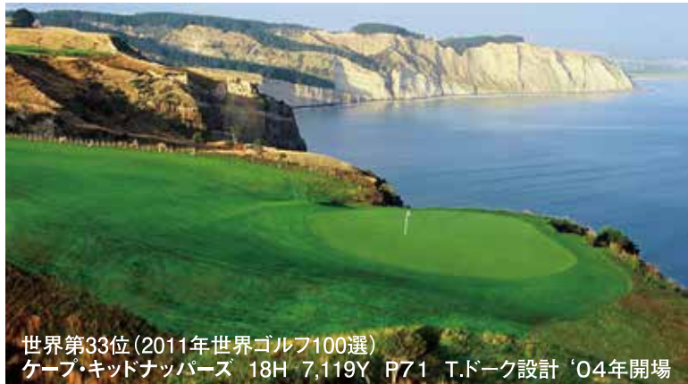
世界第33位(2011年世界ゴルフ100選) ケープ・キッドナッパーズ 18H 7,119Y P71 T.ドーク設計 '04年開場