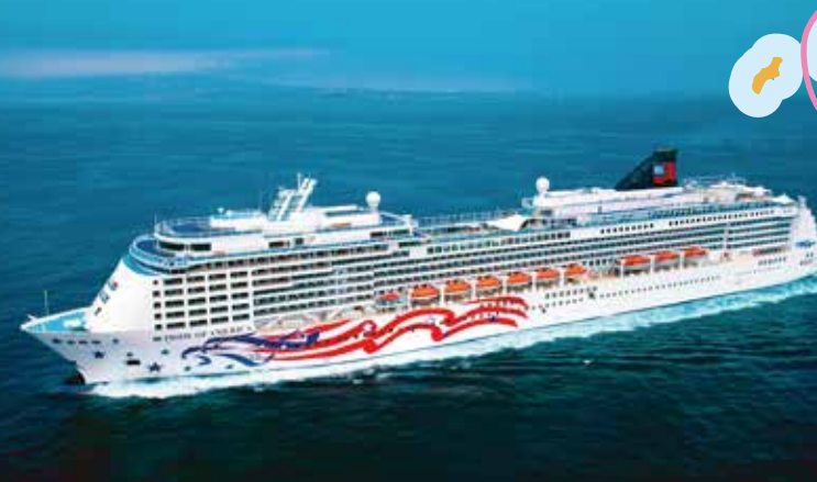
船内には9ヶ所のレストランと9のバーラウンジ 3ヶ所のプールやスポーツジムも…。

プライド・オブ・アメリカ 81,000トン 全長:280m 総客室数:1,072室 定員:2,144名