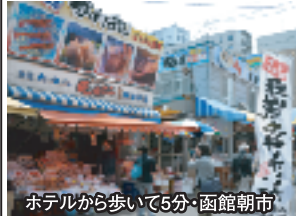
ホテルから歩いて5分・函館朝市