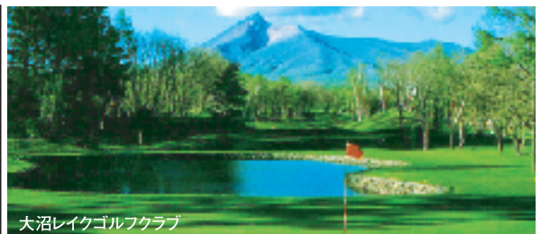
大沼レイクゴルフクラブ

★大会参加費11,000円(夕食パーティー代含む)は別途現地にて大会主催者にお支払いください。 ★募集人員:80名様 ★最少催行人員:各コース20名様 ★申込締切日:6月25日(木)