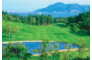
函館大沼プリンスホテル