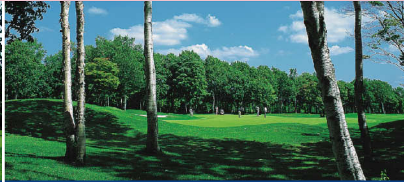
恵庭カントリー倶楽部 開場:1991年6月8日 27H 阿寒:3,571Y 支笏:3,570Y 摩周:3,452Y 設計:富澤廣親 利用税1,200円・キャディーフィー(3B) 4,320円 / (4B) 3,240円・ロッカーフィー350円

日程 2015年6月21日(日)～6月23日(火) 2泊3日 ★募集人員:80名様 ★最少催行人員:各地発20名様 ★申込締切日:6月5日(金)