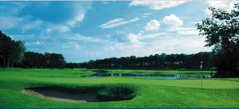
北海道クラシックゴルフクラブ 開場:1991年6月8日 18H 7,059Y ジャック・ニコラス 設計 利用税1,200円・キャディーフィー(3・4B) 4,320円