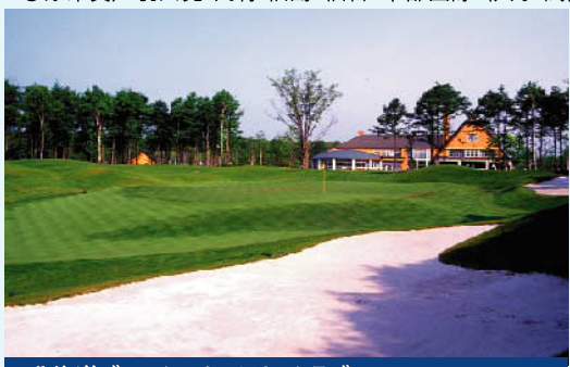
北海道ブルックスカントリークラブ 開場:1992年7月10日 18H 7,312Y 川田太三 設計 利用税1,200円・キャディーフィー(3B) 4,320円 / (4B) 3,780円