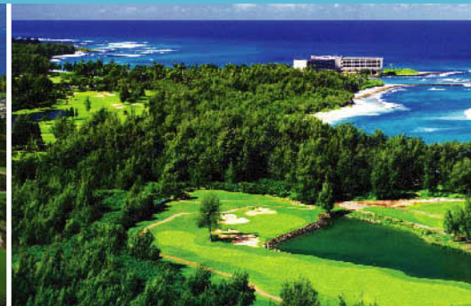
マウイ島 ワイレアゴルフクラブ・エメラルドコース