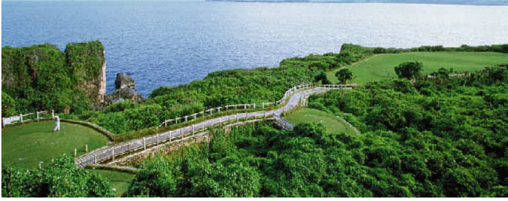
サイパン ラウラウベイゴルフリゾート イースト・ウエスト 36HS

利用コース ▶ラウラウベイイGR・イーストコース 18H 6,330Y P72 '95年開場(海超6番Par3) ▶キングフィッシャーゴルフリンクス 18H 6,651Y P72 '96年開場(海超16番Par4) ▶コーラルオーシャンポイントCC 18H 7,105Y P72 '88年開場(海超8&14番Par3)