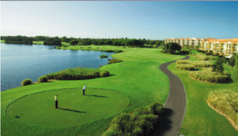
ホープアイランドリゾート 18H 7,065Y P72 P.トムソン設計 '93年開場