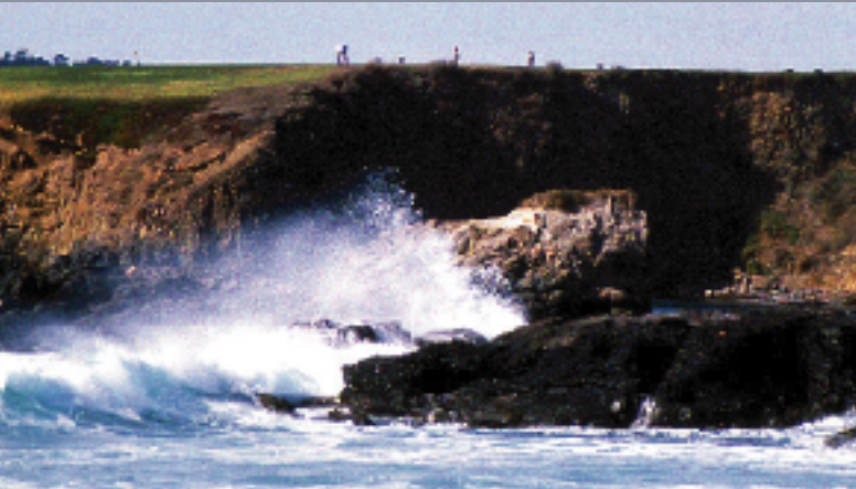
ペブルビーチゴルフリンクス 18H 6,799Y P72 J.ネービル/D.グラント設計 1919年開場