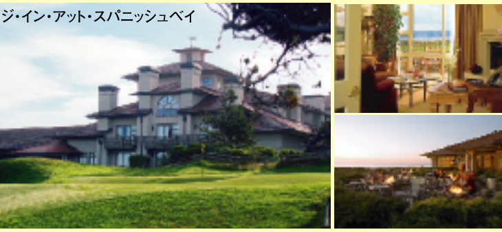
ペブルビーチリゾートにある、ジ・イン・アット・スパニッシュベイは、美しい外観と極め細やかなサービスで知られるワールドクラスのホテルです。17マイルドライブ沿いの太平洋を望む素晴らしい景色が自慢で超一流のゴルフ場に囲まれた緑いっぱいのリゾートで美しい自然をご堪能いただけます。

★18番ホールのグリーンをお部屋から望む、オーシャンビュールームへのアップグレード4泊で1ルームあたり150,000円追加