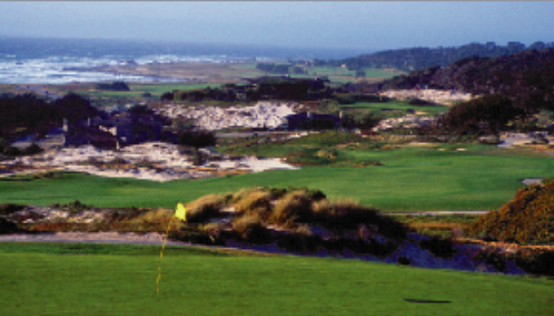
スパイグラスヒルGC 18H 6,855Y P72 R.T.ジョーンズSr.(ジュニアの父)設計