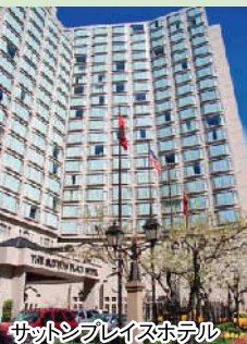
サットンプレイスホテル