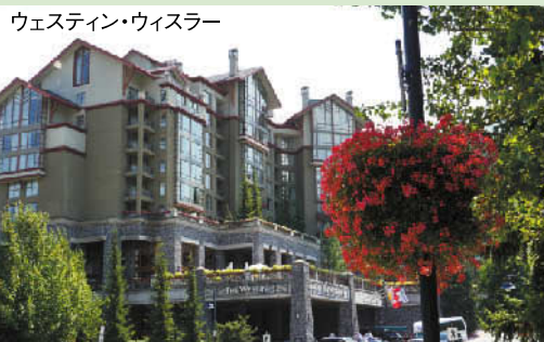
シャトーウィスラーGC