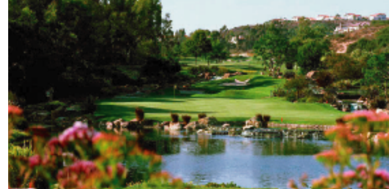
アビアラゴルフクラブ 2015年KIAクラシック(クリスティー・カー優勝)