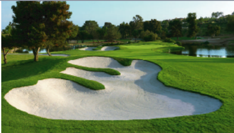
ラコスタリゾート・チャンピオンズコース 18H 7,172Y P72 D.ウィルソン設計 '65年開場