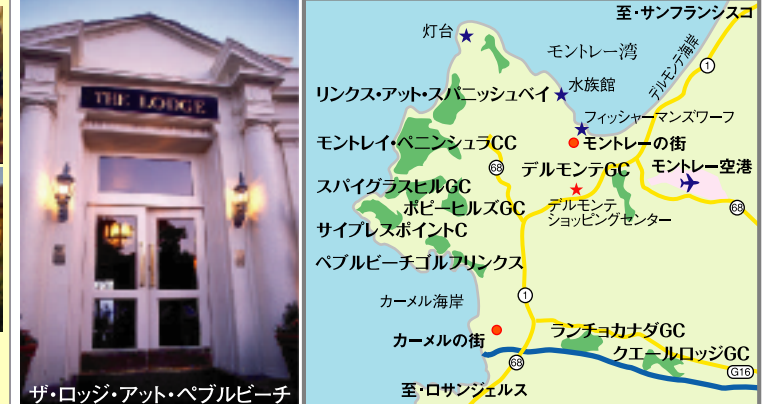
ザ・ロッジ・アット・ペブルビーチ

サンディエゴ直便で、陽光まぶしい南カリフォルニアのLPGAツアー開催コース(2012-15キアクラシック)“ラコスタGC&アビアラGC”のラウンドをお楽しみください。