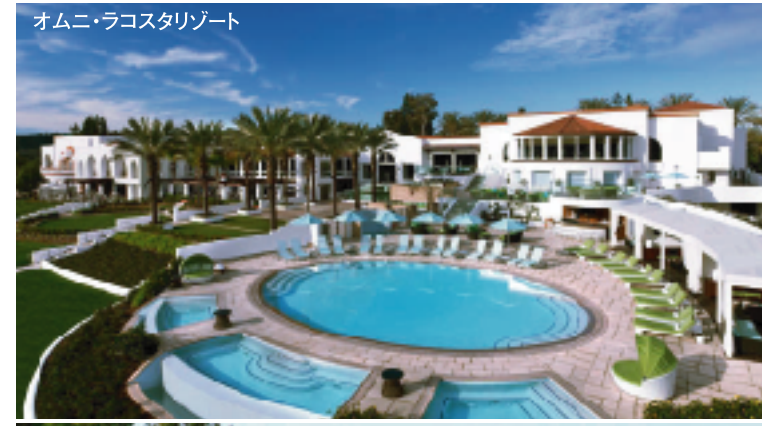
オムニ・ラコスタリゾート

設 定 ●ラコスタリゾート・チャンピオンズコース 18H 7,172Y P72 '65年開場 D.ウィルソン設計 設 定 ●ラコスタリゾート・レジェンズコース 18H 6,996Y P72 2013年リニューアルオープン 設 定 ●アビアラゴルフクラブ 18H 7,007Y P72 '87年開場 A.バーマー設計