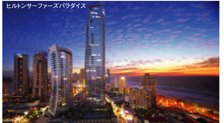
ヒルトンサーファーズパラダイス

設 定 ●ロイヤルバインズリゾート 18H 7,219Y P72 '04年リニューアル 設 定 ●レイクランズゴルフクラブ 18H 7,100Y P72 J.ニコラス設計 設 定 ●ホープアイランドリゾート 18H 7,065Y P72 P.トムソン設計