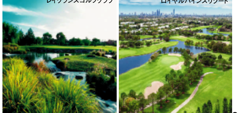
レイクランズゴルフクラブ