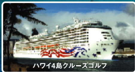
ハワイ4島クルーズゴルフ