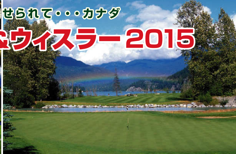
メドーガーデンゴルフクラブ 18H 7,041Y P72 1983年開場 L.ファーバー設計