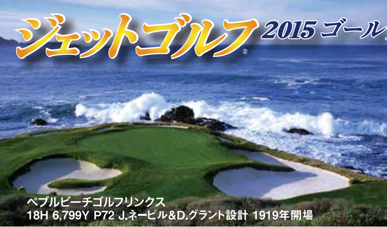
ペブルビーチゴルフリンクス 18H 6,799Y P72 J.ネービル&D.グラント設計 1919年開場