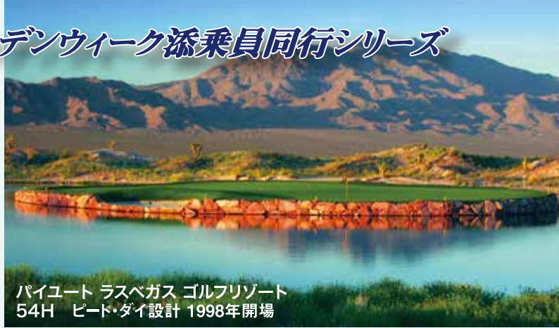
パイユート ラスベガス ゴルフリゾート 54H ビート・ダイ設計 1998年開場

憧れのロッジ・アット・ペブルに泊まって、ペブル&スパグラスをラウンドし、空路ラスベガスに移動後は、大人のリゾートベラージオに泊まり、ラスベガスの摩天楼をバックにゴージャスなラウンドを！アメリカ屈指の2つのリゾートを余すところなく遊びつくすG.W.スペシャルです。