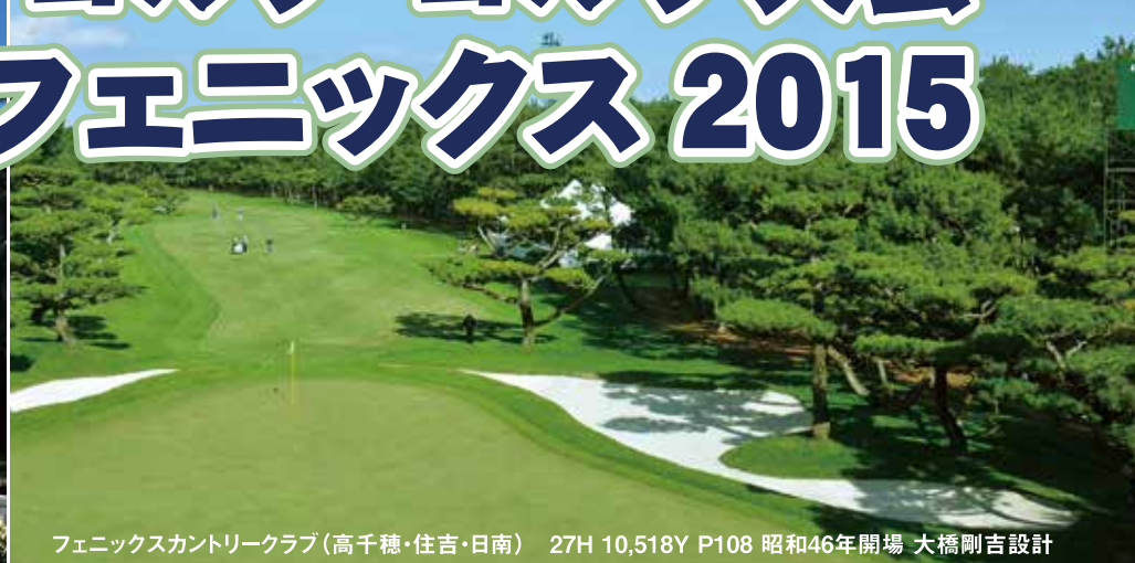
フェニックスカントリークラブ(高千穂・住吉・日南) 27H 10,518Y P108 昭和46年開場 大橋剛吉設計

冬でも緑鮮やかなフェニックスCC。ダンロップフェニックストーナメント使用コース、高千穂・住吉のワンウェイスタートでコンペ開催です。2泊3日の方は2日目のコンペとなります。