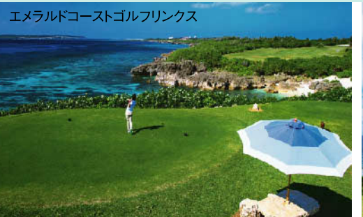
ダイナミックな海越え・コーラルハザードなど、亜熱帯宮古島の自然を取り入れた美しいリンクスコース。 ★18H 6,410Y P72 '88年開場