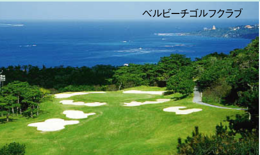
宮里兄弟が通って腕を磨いたコースとして知られる。各ホールから東シナ海に浮かぶ小島の眺めが楽しめる沖繩でも屈指の海の美しいコース。 ★18H 6,564Y P72 '91年開場