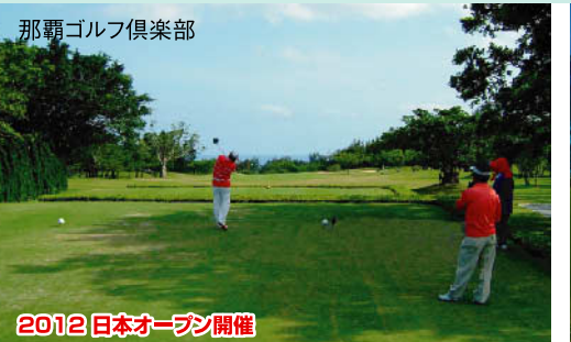
沖繩で一番フラットなフェアウェイながら、6つの池やガードバンカーの配置が巧みで緊張感のあるプレーが楽しめる。 ★18H 7,192Y P72 昭和50年開場