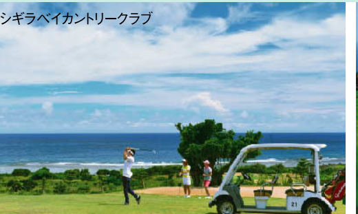
咲き誇る花々、全ホールから見渡せる宮古島の南海岸の海。リゾートの雰囲気に満ち溢れたシーサイドコース。 ★18H 6,250Y P71 2000年開場