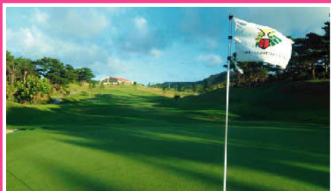
喜瀬カントリークラブ《沖縄》