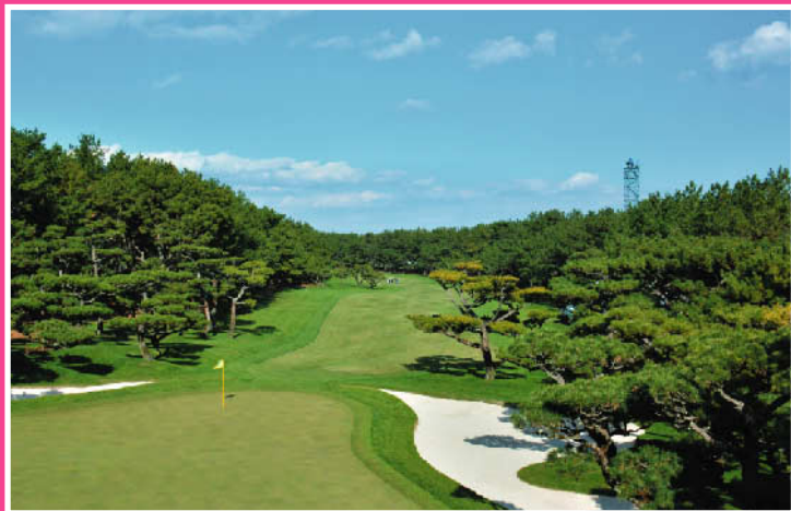
フェニックスカントリークラブ《宮崎》