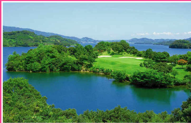
パサージュ琴海アイランドゴルフクラブ《長崎》