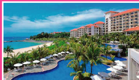
ザ・プセナテラス《沖縄》