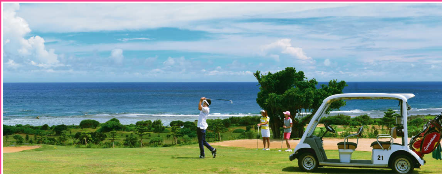
シギラバイカントリークラブ《宮古島》

実施期間 2014年12月～2015年3月 2名様より参加可能 (一部コース3名様より) ◆ 出発地: 東京・名古屋・大阪 ◆ ご出発希望日の14日前迄にお申し込みください。