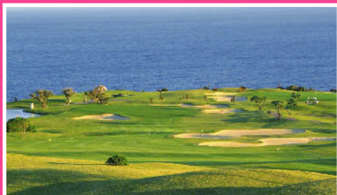
ザ・サザンリンクスゴルフクラブ《沖縄》