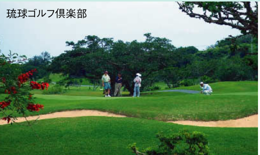
女子プロゴルフツアー開幕戦「ダイキンオーキッド」でお馴染み。太平洋を見下ろす高台にゆったりと伸びやかにレイアウトされた27ホール ★27H 10,535Y P108 昭和52年開場