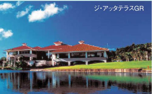
東シナ海のバラマと変化に富むフェアウェイ、ガジュマルの木やビーチバンカーなど南国情緒は、キャディー付カートで楽しいリゾートゴルフ。 ★18H 6,900Y P72 '94年開場