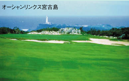
東シナ海と太平洋を一望、自然の美しさと開放感溢れる南国のイメージを存分に盛り込み、頭脳的な戦略を求められるコースです。 ★18H 6,955Y P72 1996年開場