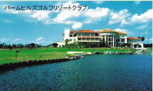
壮麗なクラブハウスに、亜熱帯の灌木や琉球石灰石のハザードを配って、沖繩で唯一欧米人デザインによるフラットで美しいコースだ。 ★18H 6,850Y P72 ロナルド・フリーマン設計 '91年開場