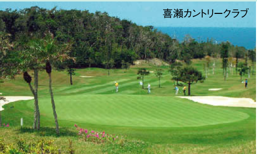
国内初の芝種、シーショアバラムが攻略の鍵。'07年日本プロゴルフ選手権を機に大規模に改修され、美しいリゾートコースながら正確な技術が要求される。 ★18H 6,814Y P72 2001年開場