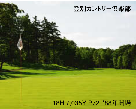
登別カントリー倶楽部