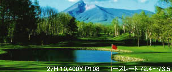
27H 10,400Y P108 コースレート 72.4～73.5