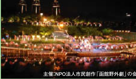
主催:NPO法人市民創作「函館野外劇」の会

函館地方の歴史を題材に、特別史跡「五稜郭」を舞台として開催、国内最大規模を誇る市民創作野外劇です。 土方歳三に逢えるかも!