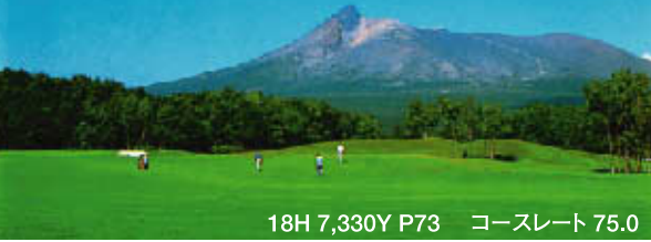
18H 7,330Y P73 コースレート 75.0