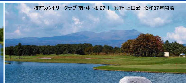
樽前カントリークラブ 南・中・北 27H 設計 上田治 昭和37年開場