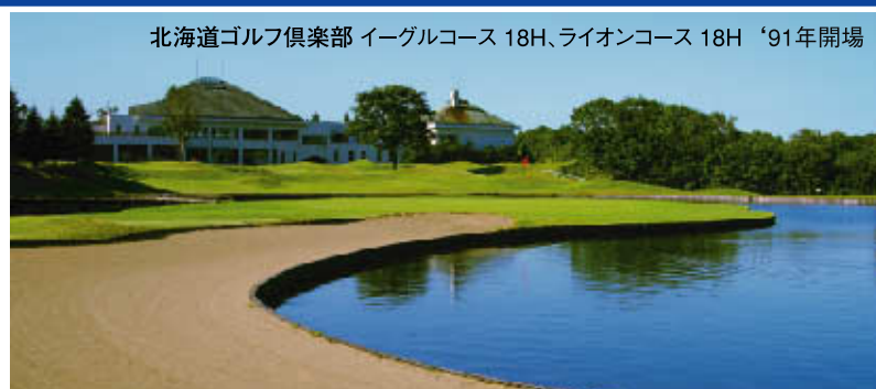
北海道ゴルフ倶楽部 イーグルコース 18H、ライオンコース 18H '91年開場

北海道は梅雨がほとんどないので、真夏でも湿度が低く爽やかな涼しさです。青空と白樺の大地に鮮やかなゼブラカットの洋芝が美しく映えてリゾート感を演出、午前・午後の2部制スループレーなので、1日に2ラウンドも可能です。屈指の名泉・温泉の数も日本一、アフターゴルフは何といっても新鮮な魚介類、北の味覚も存分にお楽しみ下さい。