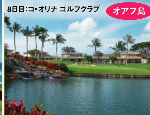
8日目:コ・オリナゴルフクラブ オアフ島