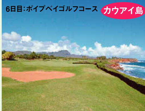
6日目:ポイブベイゴルフコース カウアイ島