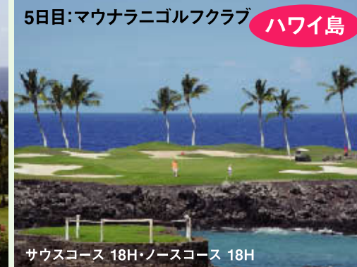
5日目:マウナラニゴルフクラブ ハワイ島 サウスコース 18H・ノースコース 18H