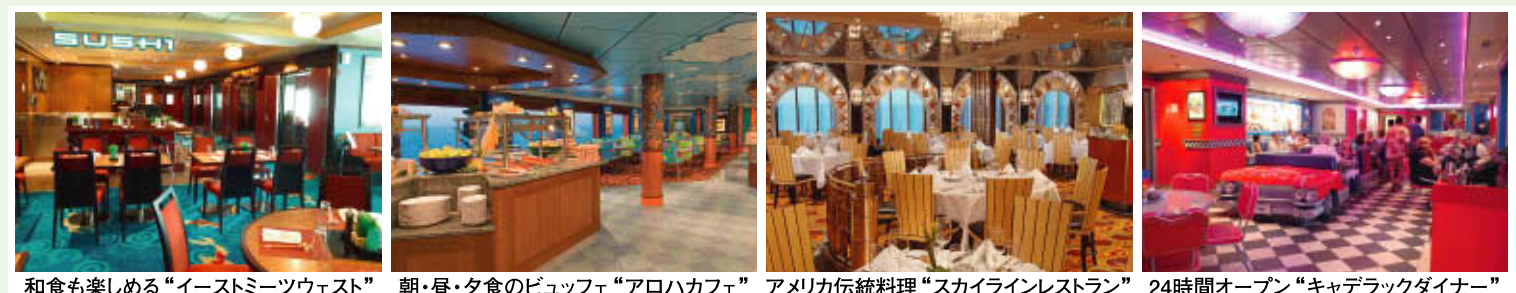
和食も楽しめる“イーストミーツウェスト” 朝・昼・夕食のビュッフェ“アロハカフェ” アメリカ伝統料理“スカイラインレストラン” 24時間オープン“キャデラックダイナー”

ハワイ4島の中で最も北に位置し、映画“ジェラシックパーク”や“南太平洋”の舞台となった神秘の島、断崖絶壁が20kmも続くナバリコーストを船上から望む。