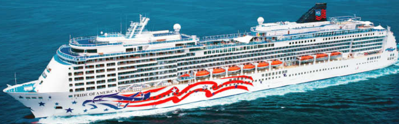
プライド・オブ・アメリカ 81,000トン 全長:280m 総客室数:1,069室 定員:2,138名 船内には9ヶ所のレストランと10のバーラウンジ 3ヶ所のプールやスポーツジムも……。

豪華客船“プライド・オブ・アメリカ”に7泊して、4島の代表的なコースを巡る究極のハワイゴルフの旅。毎日開催のディナーショーやアトラクション、寄港地観光も充実しているので、ゴルフなし同伴参加も楽しい。