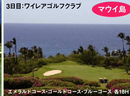
3日目:ワイレアゴルフクラブ マウイ島 エメラルドコース・ゴールドコース・ブルーコース 各18H