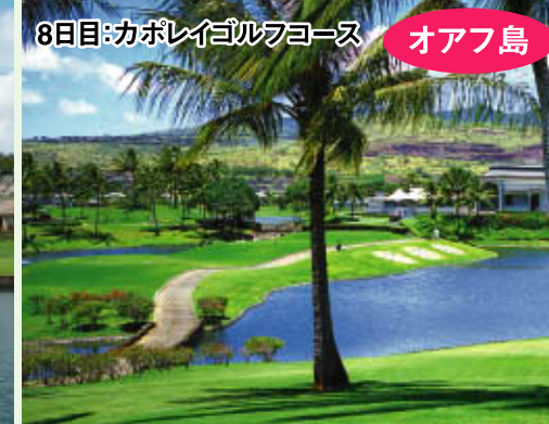
8日目:カボレイゴルフコース オアフ島