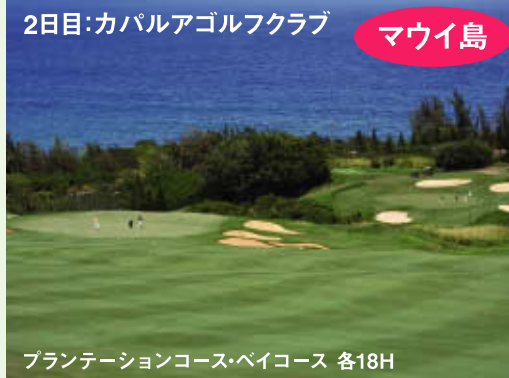
2日目:カパルアゴルフクラブ マウイ島 プランテーションコース・ベイコース 各18H