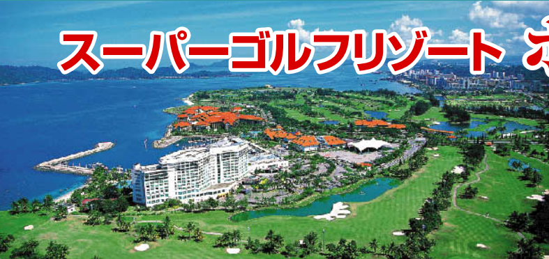
ステラハーバーゴルフ&CC 27H P108 G.マーシュ設計 '97年開場

南洋樹と真白なバンカーでセパレートされた27Hは、フラットで比較的イージー、ビギナーやレディーズにも快適な乗用カート利用で気楽にリゾートゴルフが楽しめる。