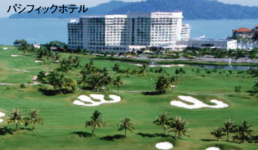
広大なステラハーバーリゾート&スパ

パシフィックホテル(500室)とマゼランホテル(465室)の2つの5つ星ホテルとステラハーバーGCからなるシンガポール資本の広大なリゾートは、中華・イタリアなど15カ所の飲食施設を誇る。それに4つのプール、高級スパ(各種マッサージ)等も完備され、各施設間はシャトルバスで移動する。夏はイギリス、ドイツなどヨーロッパ系、冬場はアジアからの観光客で賑わう。