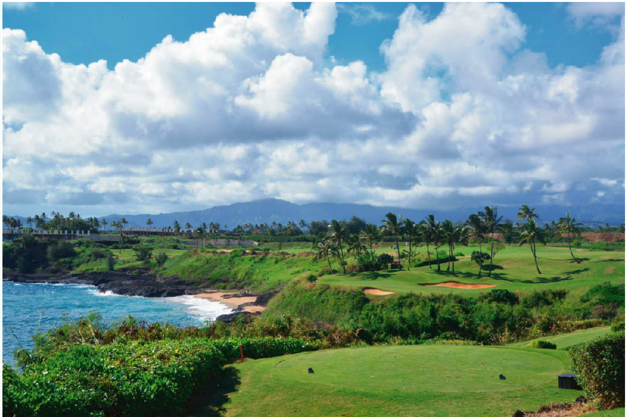
カウアイラグーン・キエレコース (ハワイ)