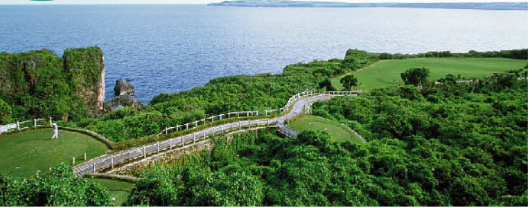
サイパン ラウラウベイゴルフリゾート イースト・ウエスト 36HS