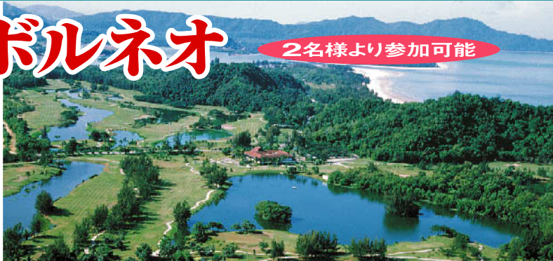
ダリットベイゴルフ&カントリークラブ 18H 6,904Y P72 E.G.パースロー設計 '99年開場

南洋樹と真白なバンカーでセパレートされた27Hは、フラットで比較的イージー、ビギナーやレディーズにも快適な乗用カート利用で気楽にリゾートゴルフが楽しめる。