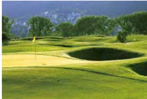
プラハシティーゴルフクラブ 18H 7,173Y P72 J.フォード設計 '09年開場