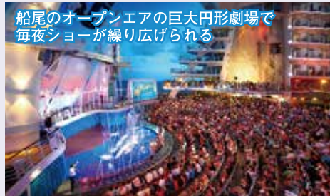
船尾のオープンエアの巨大円形劇場で 毎夜ショーが繰り広げられる