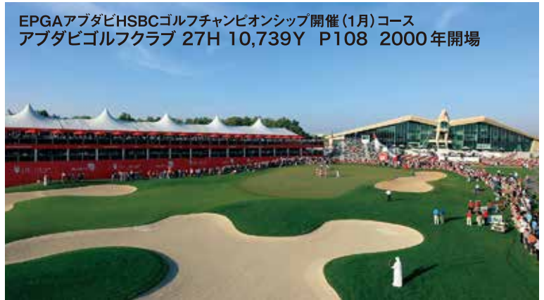
EPGA アブダビHSBCゴルフチャンピオンシップ開催(1月)コース アブダビゴルフクラブ 27H 10,739Y P108 2000年開場

高層ビルがそびえたつ異次元の世界 “ドバイ&アブダビ”で欧州PGAツアー開催コースはじめ個性豊かなチャンピオンコースを4ラウンド! アラビアン建築の豪華な“グランドモスク”や世界遺産“アルアイン”、世界一高いビル“バージュカリファ(828m)”など充実の観光もお楽しみに・・・