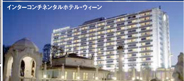
インターコンチネンタルホテル・ウィーン 有名ナリング通りにあるホテル。白を基調とした外観はモダンで清潔感に満ち溢れ、客室もダークブラウンの家具が落ち着いた雰囲気醸し出している。楽友教会やオペラ座も徒歩圏内と大変便利。