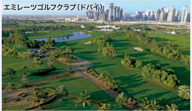
エミレーツゴルフクラブ(ドバイ)