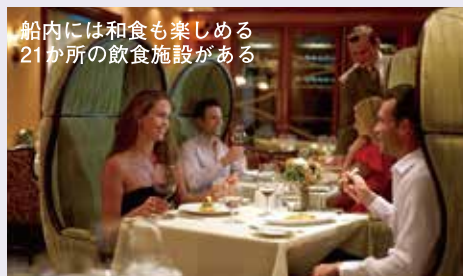
船内には和食も楽しめる 21か所の飲食施設がある