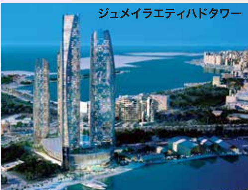
ジュメイラエティハドタワー