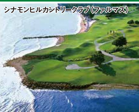
18H 6,637Y P72 2001年開場 R.ボンヘギー設計