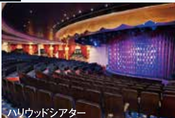
ハリウッドシアター