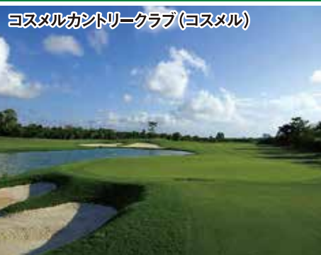
18H 6,734Y P72 2006年開場 J.ニコラス設計