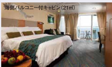
海側バルコニー付キャビン(21㎡)