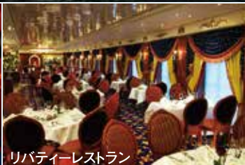
リバーティレストラン