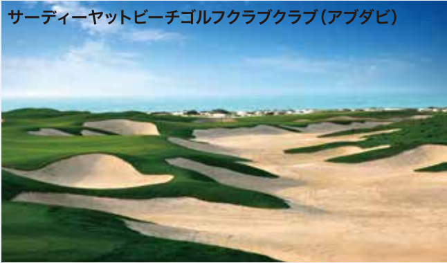
サーディーヤットビーチゴルフクラブ(アブダビ)