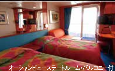
オーシャンビューステートルーム・バルコニー付