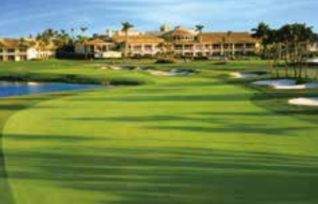
18H 7,125Y P72 1962年開場 D.ウィルソン設計

TPCブルーモンスターatドラール(マイアミ) 毎年3月 WGCキャデラック選手権開催