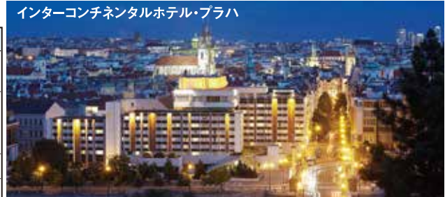
インターコンチネンタルホテル・プラハ プルタバ河に面したデラックスホテル。旧市街とプルタバ河を望む客室はページュを基調としたモダンなヨーロピアンスタイルの上品な作りで人気のホテルです。