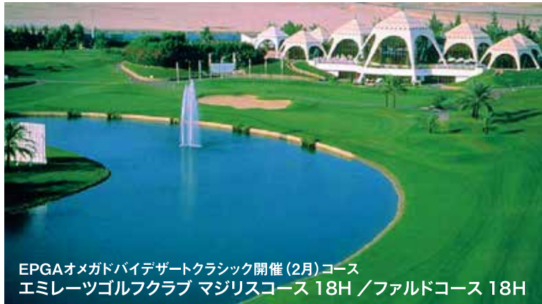
EPGAオメガデザートクラシック開催(2月)コース エミレーツゴルフクラブ マジリスコース 18H / ファルドコース 18H