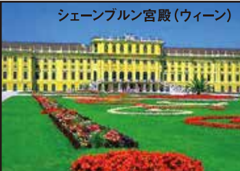
シェーンブルン宮殿(ウィーン)