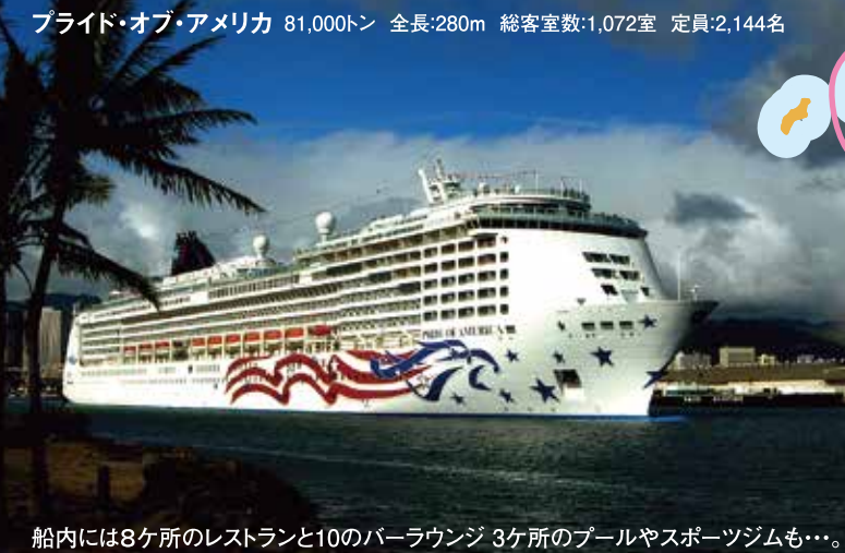
船内には8ヶ所のレストランと10のバーラウンジ 3ヶ所のプールやスポーツジムも…。

プライド・オブ・アメリカ 81,000トン 全長:280m 総客室数:1,072室 定員:2,144名