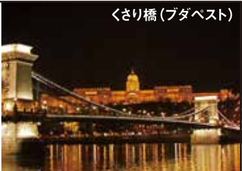
くさり橋(ブタペスト)

ヨーロッパのほぼ中央に位置する中欧三国（オーストリア、チェコ、ハンガリー）13世紀ヨーロッパ全土を支配しハプスブルグ家の王朝として詠歌を極めたオーストリア・ウィーンは音楽の都として名高く、モーツァルトやバッハなどの著名な音楽家を輩出した。10世紀以降、貿易の中心として栄えたチェコの首都プラハは「百塔の街」と讃えられ世界遺産に登録されている。2本の大河が流れるブタペストは他国の支配や影響を受けながらも独自の文化を守り続けた町です。文明のルーツは共通ながら歴史と文化の歩み、豊かな自然風景にはそれぞれ異なる魅力ある中欧三都をお楽しみ下さい。