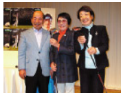
第4回大会イメージ