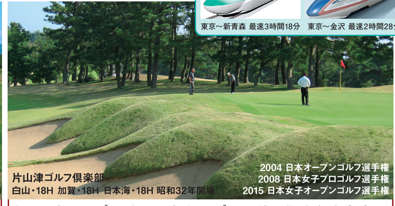
片山津ゴルフ倶楽部 白山・18H 加賀・18H 日本海・18H 昭和32年開場

●7/12、8/9、9/13・20、10/11・20・21 出発は土曜発代金が適用されます。 含まれるもの ●羽田～青森 個人包括割引運賃適用の往復航空運賃、空港施設使用料 ●2ラウンドのGF・諸費用(利用税・キャディーフィーを除く) ●1泊朝食付宿泊料(2～3名様1室利用) ●行程中に明示した区間の送迎料金