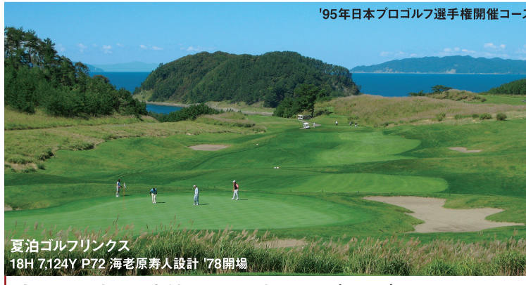
夏泊ゴルフリンクス 18H 7,124Y P72 海老原寿人設計 '78開場

●7/12、8/9、9/13・20、10/11・20・21 出発は土曜発代金が適用されます。 含まれるもの ●東京(又は上野・大宮)→盛岡 往復JR運賃、新幹線特急料金(指定) ●2ラウンドのGF・諸費用(利用税・キャディーフィーを除く) ●1泊朝夕食付宿泊料(2～3名様1室利用) ●行程中に明示した区間の送迎料金