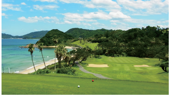
芥屋ゴルフ倶楽部 18H 7,144Y P72