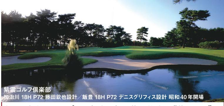
紫雲ゴルフ倶楽部 加治川 18H P72 藤田欽也設計/飯豊 18H P72 デニスグリフィス設計 昭和40年開場

'08日本女子オープンの舞台、名匠藤田欽也の“紫雲GC”と雄大なシーサイドコース“日本海”の2プレイ。一部行程送迎付