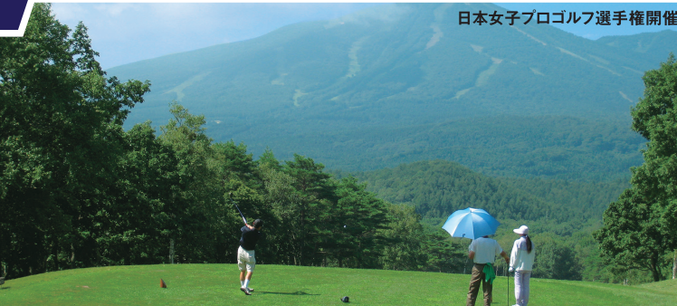
安比高原ゴルフクラブ チャンピオンコース 18H 6,979Y P72 新井剛設計 '78年開場

含まれるもの ●東京(又は上野・大宮)→中条、新潟→東京のJR運賃、特急料金(指定) ●2ラウンドのGF・諸費用(利用税・キャディーフィーを除く) ●1泊朝食付宿泊料(2～3名様1室利用) ●行程中に明示した区間の送迎料金