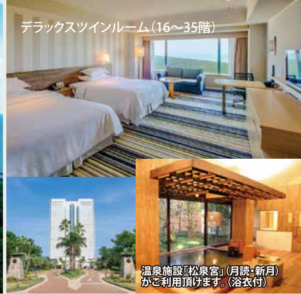
デラックスツインルーム(16~35階)