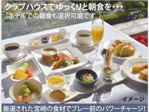
クラブハウスでゆっくりと朝食を・・・(ホテルでの朝食も選択可能です。)

受診前の注意点 ご出発前に鶴田記念クリニックより予定日の確認と検査内容の説明の電話があります。ご不明の点はその際に充分お確かめ頂くことができます。