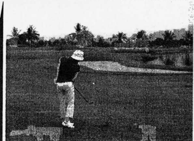
ホルネオGCはほとんどのホールで池や川が絡む戦略的コース

ティフトン芝が主流 ○：サバ州には19コースあり、ほとん どがティフトン芝。距離表示もメートル 式のため、ベントグリーンやヤード式に 慣れた日本人には戸惑いも多い。た だ、距離計算に関してはGCS(ナドゲ ーションシステム)導入が推進されてい るため、近く問題は解消される方向だ。言 葉に関しては、英連邦からマレーシア はたしての場所まで英語が通じる。ホテ ル内にも日本人スタッフがおり、心配の 必要はなさそうだ。