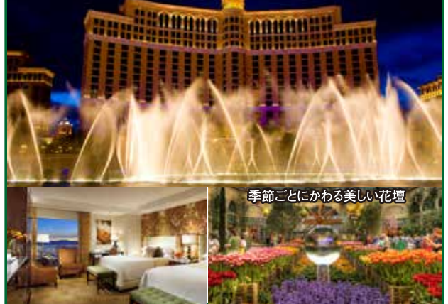
季節ごとにかわる美しい花壇