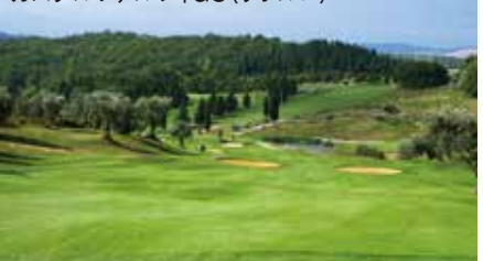
カステルファルフィGC(リボルノ)