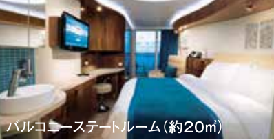
バルコニー・ステートルーム(約20㎡)

とかくヨーロッパのクルーズ船は朝・昼・夕食を毎日同じテーブルで主に洋食をお楽しみ頂く事になりますが、ノルウェー・エピックの「フリースタイルクルージング」は6カ所の無料レストランの他にステーキやイタリアン、中華に和食も楽しめるスペシャリティーレストラン(有料)があるので好きな料理をお好きな時間にお楽しみいただけます。