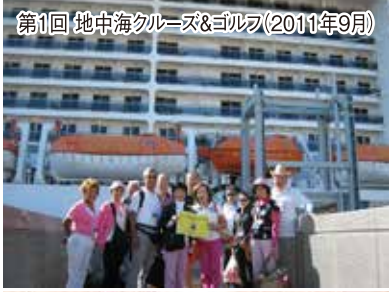
第1回 地中海クルーズ&ゴルフ(2011年9月)

ノルウェー・エピック ●155,000トン ●全長:329m ●総客室数:2,114室 ●定員:4,100名