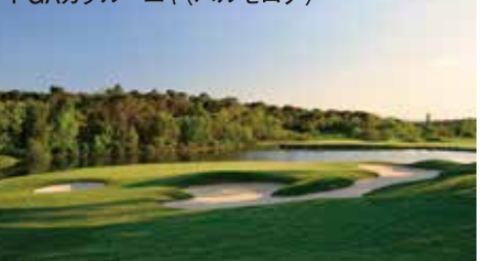
PGAカタルーニャ(バルセロナ)