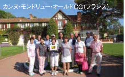
カヌ・モンドリュエール・オールドCG(フランス)