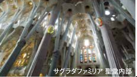
サグラダファミリア 聖堂内部