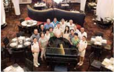
第4回 地中海クルーズ&ゴルフ(2014年9月)