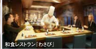
和食レストラン「わさび」