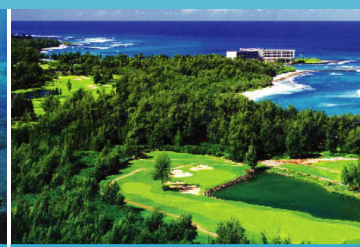
マウイ島 ワイレアゴルフクラブ・エメラルドコース