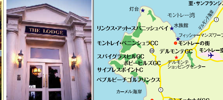
ザ・ロッジ・アット・ペブルビーチ