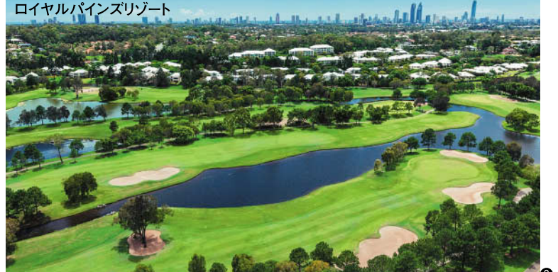
ロイヤルバインズリゾート