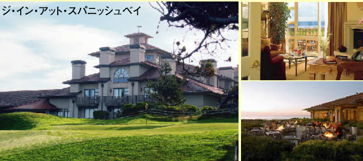
ジ・イン・アット・スパニッシュベイ

★18番ホールのグリーンをお部屋から望む、オーシャンビュールームへのアップグレード4泊で1ルームあたり130,000円追加