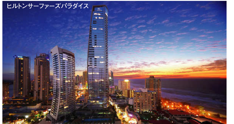
ヒルトンサーファーズパラダイス

設 定 場 所 ▶ロイヤルバインズリゾート 18H 7,219Y P72 '04年リニューアル ▶レイ克蘭ズゴルフクラブ 18H 7,100Y P72 J.ニコラス設計 ▶ホープアイランドリゾート 18H 7,065Y P72 P.トムソン設計