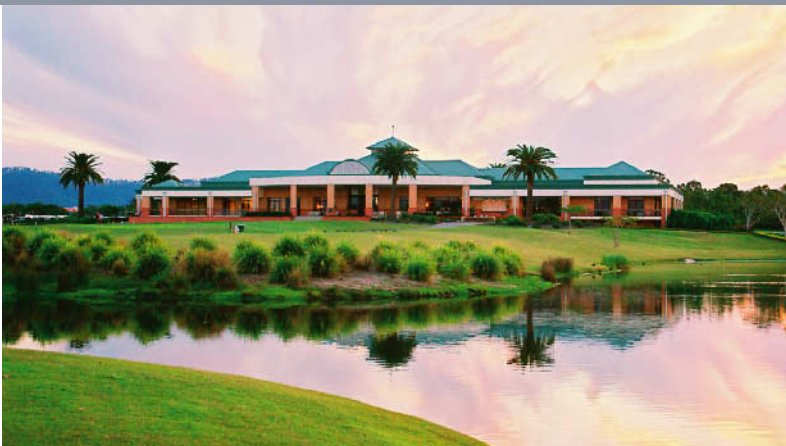
レイ克蘭ズゴルフクラブ 18H 7,100Y P72 J.ニコラス設計 '97年開場