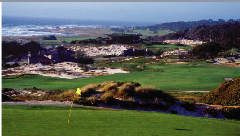
スパイグラスヒルGC 18H 6,855Y P72 R.T.ジョーンズSr.(ジュニアの父)設計