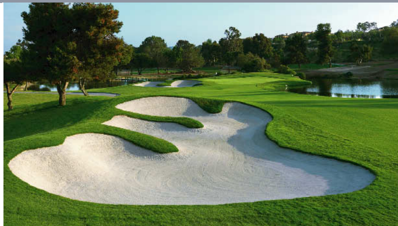
ラコスタリゾート・チャンピオンズコース 18H 7,172Y P72 D.ウィルソン設計 '65年開場