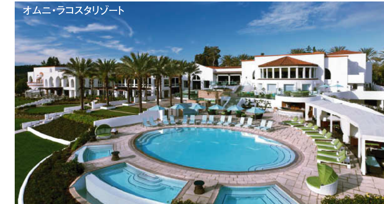
オムニ・ラコスタリゾート

設 定 場 所 ▶ラコスタリゾート・チャンピオンズコース 18H 7,172Y P72 '65年開場 D.ウィルソン設計 ▶ラコスタリゾート・レジェンズコース 18H 6,996Y P72 2013年リニューアルオープン ▶アビアラゴルフクラブ 18H 7,007Y P72 '87年開場 A.バーマー設計