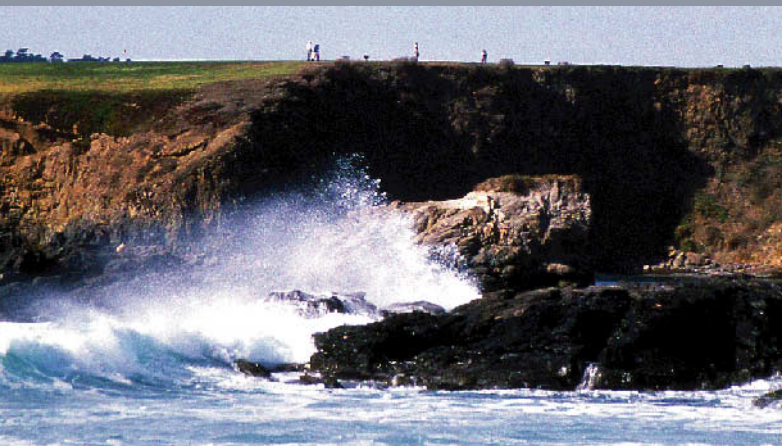
ペブルビーチゴルフリンクス 18H 6,799Y P72 J.ネービル/D.グラント設計 1919年開場