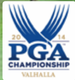
18H 7,540Y P72 1986年開場 ジャック・ニコラス設計