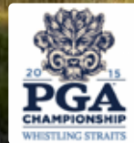
18H 7,790Y P72 1997年開場 ピート・ダイ設計