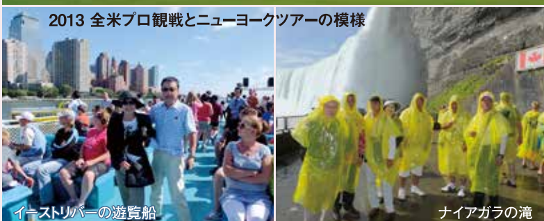
イーストリバーの遊覧船