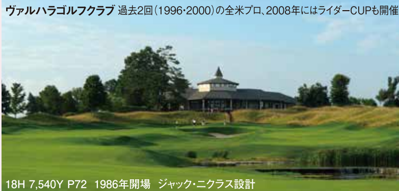
ヴァルハラゴルフクラブ 過去2回(1996・2000)の全米プロ、2008年にはライダーCUPも開催