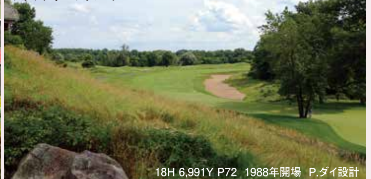
18H 6,991Y P72 1988年開場 P.ダイ設計