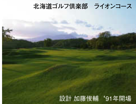
設計 加藤俊輔 '91年開場