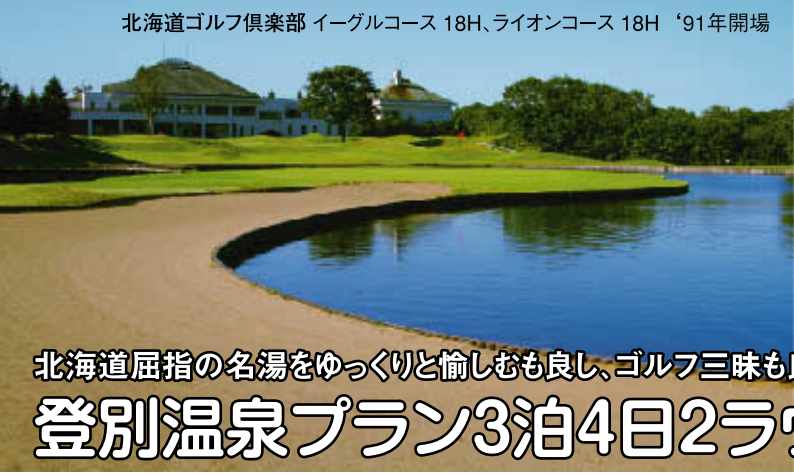
北海道ゴルフ倶楽部 イーグルコース 18H、ライオンコース 18H '91年開場