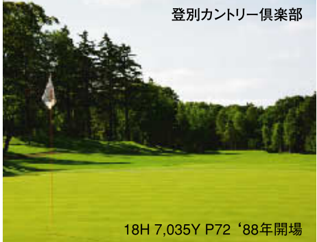
18H 7,035Y P72 '88年開場