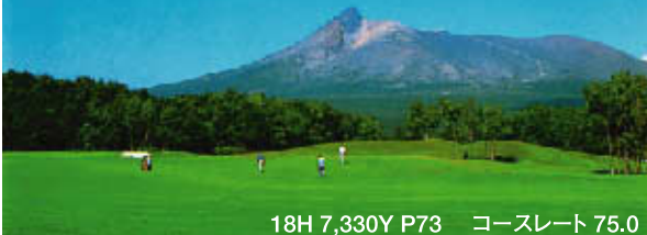
18H 7,330Y P73 コースレート 75.0