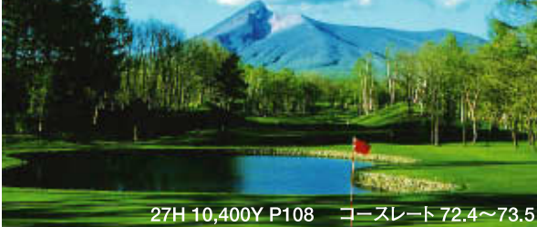
27H 10,400Y P108 コースレート 72.4～73.5