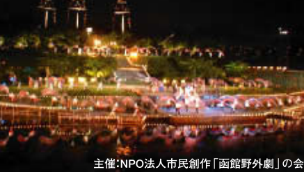
主催:NPO法人市民創作「函館野外劇」の会

函館地方の歴史を題材に、特別史跡“五稜郭”を舞台として開催、国内最大規模を誇る市民創作野外劇です。 土方歳三に逢えるかも!