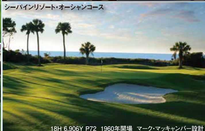
シーパインリゾート・オーシャンコース