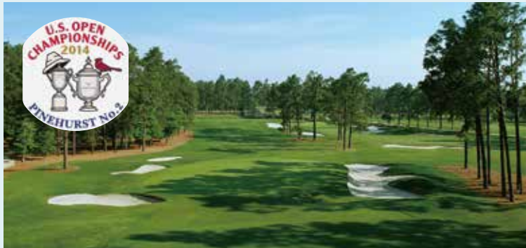
パインハーストNo.2 18H 6,930Y P72 1907年開場 D.ロス設計 2014年全米オープン開催

1999年ペイン・スチュアートとフィル・ミケルソンが死闘を演じた“パインハーストNo.2”(1907開場)で第114回全米オープンを観戦、PGAツアー46年連続開催『ザ・ヘリテージ』の舞台“ハーバータウンGL”(1969開場)をお楽しみください。