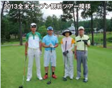
2013全米オープン観戦:ソアー模様