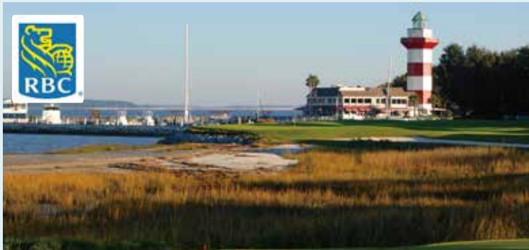
ハーバータウンゴルフリンクス 18H 7,101Y P72 1969年開場 P.ダイ設計 RBCヘリテージ開催コース

全米に400を超える作品を遺した設計家 ドナルド・ロスはスコットランド・ドーンロック出身、トム・モリスに師事して27才で渡米。1898年開場のNo.1コースの改修を手始めに、1919年までにNo.2・3・4を設計、コース内に自宅を建てて30数年の後半生をその完成に捧げた。18ホールが8コース、4ヶ所のホテルなど、全米屈指のコルフリゾートだ。