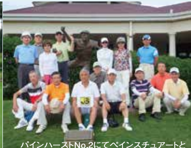
パインハーストNo.2にてペインスチュアートと