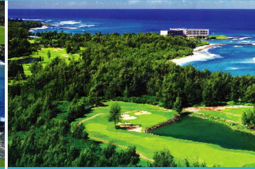
マウイ島 ワイレアゴルフクラブ・エメラルドコース