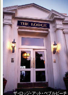
ザ・ロッジ・アット・ペブルビーチ