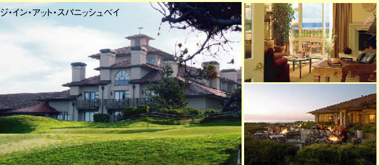
ペブルビーチリゾートにある、ジ・イン・アット・スパニッシュベイは、美しい外観と極め細やかなサービスで知られるワールドクラスのホテルです。17マイルドライブ沿いの太平洋を望む素晴らしい景色が自慢で超一流のゴルフ場に囲まれた緑いっばいのリゾートで美しい自然をご堪能いただけます。

☆18番ホールのグリーンをお部屋から望む、オーシャンビュールームへのアップグレード4泊で1ルームあたり140,000円追加