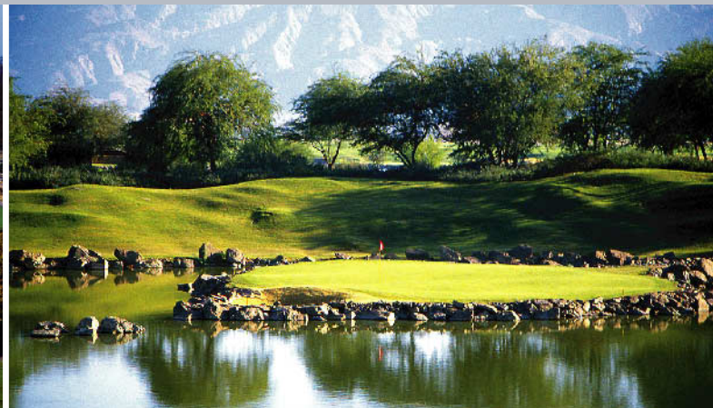
PGAウエスト・TPCスタジアムコース 18H 7,266Y P72 P.ダイ設計 '86年開場