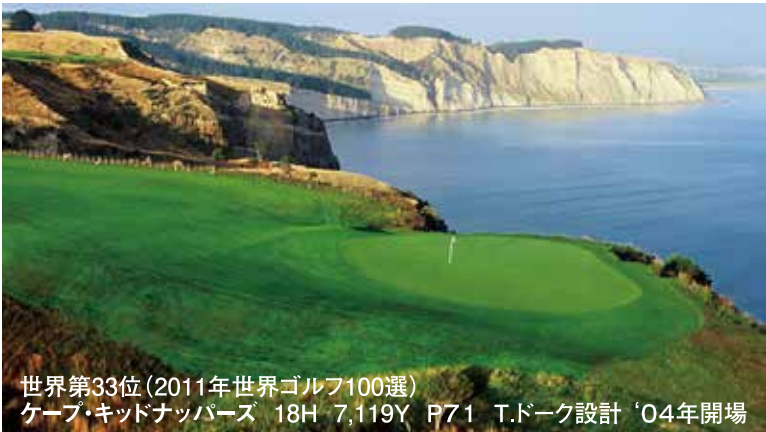
世界第33位(2011年世界ゴルフ100選) ケープ・キッドナッパーズ 18H 7,119Y P71 T.ドーク設計 '04年開場