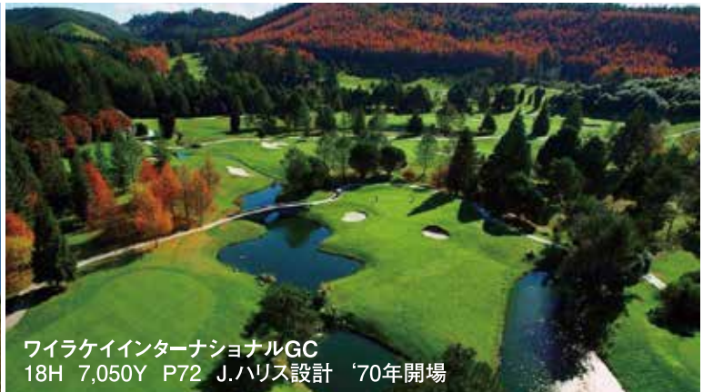
ワイラケインターナショナルGC 18H 7,050Y P72 J.ハリス設計 '70年開場

日中の最高気温25度前後と爽やかな気候の中、雄大な景色が広がるタウボ湖畔に泊まり、ワイラケインターナショナルGCとJ.ニクラス設計のキンロッククラブをプレー。せっかくの想いで造りに、スリル満点の断崖絶壁“ケープ・キッドナッパーズ”を2回お楽しみ下さい。