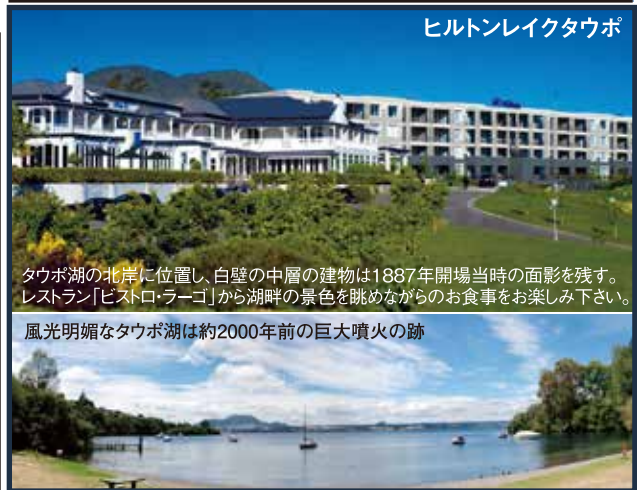
ヒルトンレイクタウポ

タウポ湖の北岸に位置し、白壁の中層の建物は1887年開場当時の面影を残す。レストラン「ビストロ・ラゴ」から湖畔の景色を眺めながらのお食事をお楽しみ下さい。