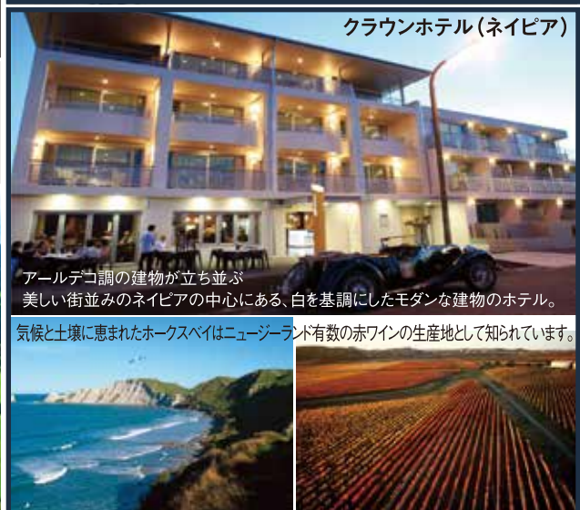
クラウンホテル(ネイピア)

アールデコ調の建物が立ち並ぶ 美しい街並みのネイピアの中心にある、白を基調にしたモダンな建物のホテル。